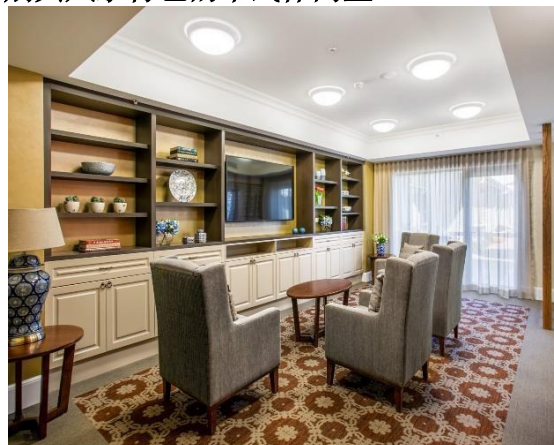
別具風水特色的中式休閒室